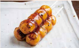
和菓子 コモリ餅店

須坂市北横町1316-11 ☎026-245-0528 ☺9:00~17:00 ◎不定休