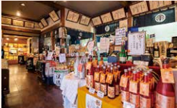
日本酒製造 遠藤酒造場

須坂市須坂1528-3 島田ビル1F西 ☎非公開 ☺11:30~16:00 ◎不定休