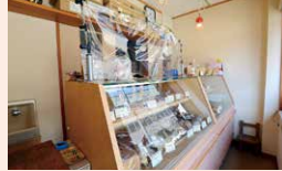
パン 三河屋パン店

須坂市北横町1323 ☎026-245-2847 ☺8:30~18:00 ◎日曜、第2・4月曜