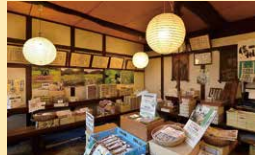
蕎麦製造 小妻屋本店

須坂市須坂383 ☎026-248-0332 ☺10:00~16:30 ◎日曜、ほか不定休