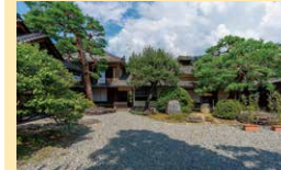
土産 田中本家博物館

須坂市穀町476 ☎026-248-8008 ☺11:00 ~15:30、土日祝10:00~16:00 ◎火曜