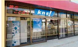
旅行 日本ツーリスト

須坂市北横町1322 ☎026-246-1743 ☺10:00~16:00 ◎土・日曜、祝日