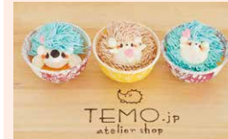
洋菓子 TEMO.jp atelier shop

須坂市北横町1314 ☎026-285-9089 ☺11:00~16:00 ◎日・月曜