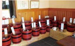
味噌 土屋味噌醤油醸造場

須坂市須坂383 ☎026-248-0332 ☺10:00~16:30 ◎日曜、ほか不定休