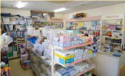
文具 カミヤ長張商店

須坂市須坂1370 ☎026-245-0359 ☺9:00~18:30 ◎日曜、祝日