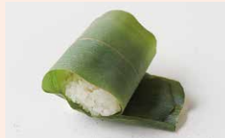
和菓子 玉林餅菓子店

須坂市穀町529-7 ☎026-245-0541 ☺8:00~18:30 ◎月曜