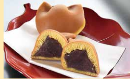
菓子 ちよか盛進堂

須坂市北横町1323 ☎026-245-2847 ☺8:30~18:00 ◎日曜、第2・4月曜