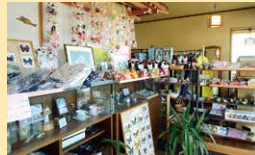
着物 キモノのゆきわ

須坂市新町885-22 ☎026-248-4840 ☺9:00~18:00 ◎不定休