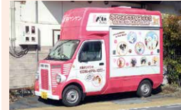
ペットホテル 犬処ケンケン

須坂市東横町1416 ☎026-245-1022 ☺8:00~18:00 ◎水曜(ホテルは要確認)