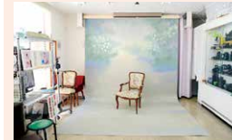
写真 カメラショップイワイ

須坂市須坂1266-16 ☎026-245-7564 ☺9:30~18:00 ◎水曜