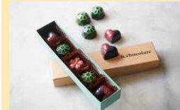
洋菓子 & chocolate

須坂市北横町1314 ☎026-285-9089 ☺11:00~16:00 ◎日・月曜