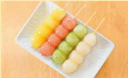
和菓子 つたや本店

須坂市穀町529-7 ☎026-245-0541 ☺8:00~18:30 ◎月曜