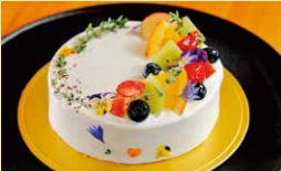
洋菓子 Pâtisserie Café Sincere

須坂市須坂1528-3 島田ビル1F西 ☎非公開 ☺11:30~16:00 ◎不定休