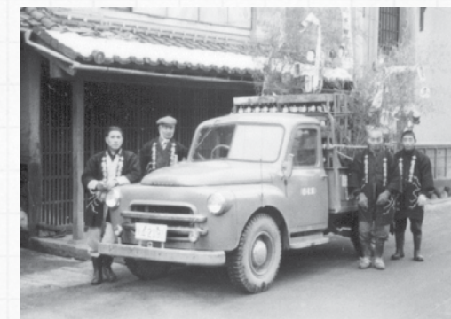
塩屋醸造 初荷の風景 (1950～60年代頃)