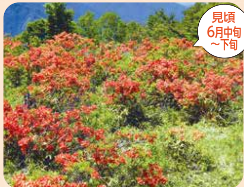
見頃 6月中旬 ~下旬

株の大きさと株数で県内最大規模100万株ともいわれる大群落が一斉に咲き誇り、高原をオレンジに染める。北信五岳・北アルプスや善光寺平が一望できる眺望は格別。