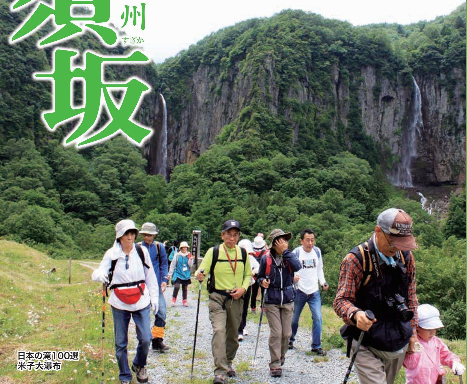
日本の滝100選 米子大瀑布